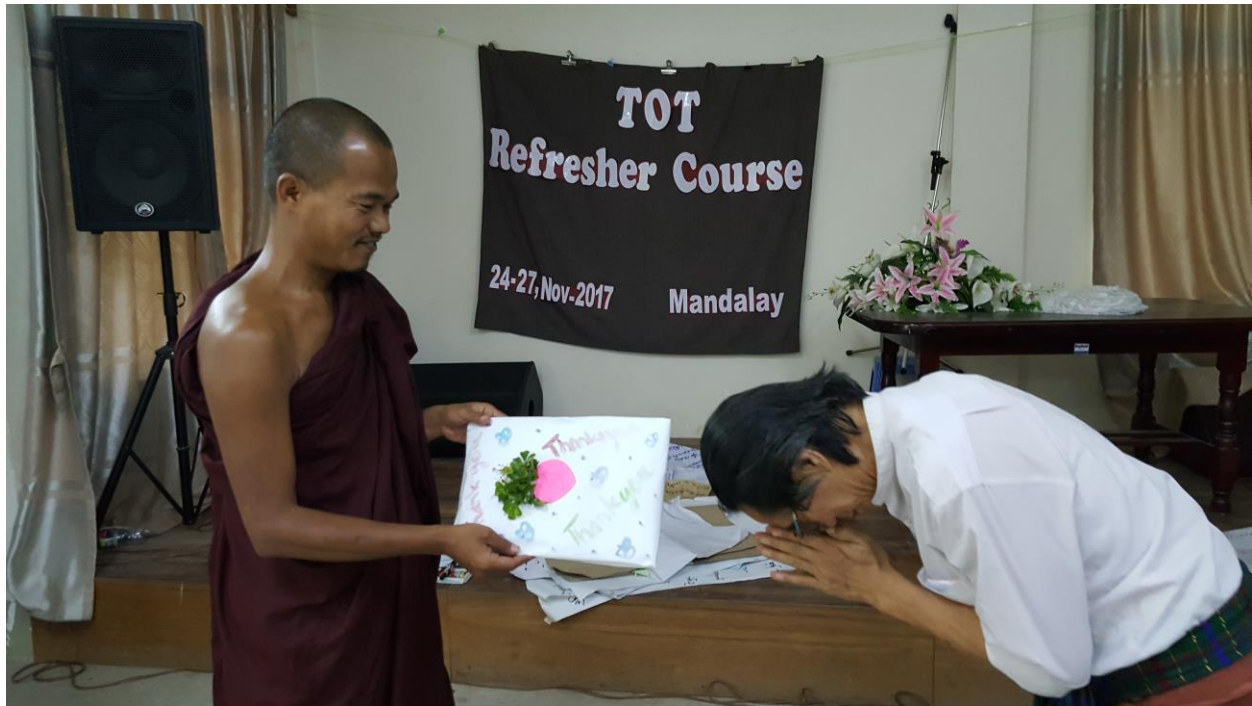
၂၀၁၃ TOT Refresher Course ကလေးတော့ဖြင့် ဒီတင်ပဲ နိဗ္ဗိတံ။

သင်တန်းနောက်ဆုံးနေ့မှာတော့ဖြင့် ဆရာချန်ခဲ့တဲ့ Tool တွေနဲ့ Individual analysis လုပ်ကြရပါတယ်။ အဲဒါကလေး မလုပ်ခင် မိမိ ၂၀၁၃ အဖွဲ့အချင်းချင်း စသဖြင့် အမှတ်တရကလေးတွေ ပြောခိုင်းတယ်။ အဲဒီအမှတ်တရကလေးကိုလည်း Role Play နဲ့ တင်ဆက်စေပါသေးတယ်။ ပြီးတော့ Individual analysis ကို နေ့လည်လောက်မှာ လုပ်ပါတယ်။ ၂၀၁၃ အဖွဲ့ကနေ Brain Gym ကစားပေးပြီး တစ်ဦးချင်းစီကို Video record လုပ်ပြီးတော့ကို ပြောခိုင်းတယ်။ အဆုံးသတ်မှာလည်း သင်တန်းမှာ ဘာရလိုက်သလဲ ပြောစေပါတယ်။ ကျေးဇူးတင်စကားတွေလည်း ပြောကြပါတယ်။